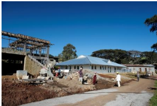
Baustelle am Hamlin Midwifery College

Inzwischen sind die neuen Hebammen in ihren ursprünglichen Heimatgebieten in den ländlichen Regionen stationiert und bereits im Einsatz. Dazu mussten sie sich vor ihrer Ausbildung verpflichten. Vor ihrem Abschluss durchliefen die Hebammen verschiedene Stationen, darunter ein intensives klinisches Praktikum in ihren Heimatgebieten. Hier wurden sie beauftragt, Gesundheitserziehung und Aufklärung auf Gemeindeebene zu leisten, mit Vorträgen in Schulen, bei Frauenverbänden, und auf Treffen der regionalen Verwaltungseinheiten. Dabei sprachen sie teilweise vor hunderten von Schülern - eine beachtliche Leistung vollbrachten. In der zweiten Phase des Studiums standen Besuche in den Außenzentren Bahir Dar, Mekelle und Yirgalem für jeweils acht Wochen an. Dort mussten die Studentinnen bereits selbstständig Problemgeburten betreuen – z.B. Zwillingsgeburten, oder in Fällen, in denen die manuelle Entfernung der Plazenta erforderlich wurde. Jede der