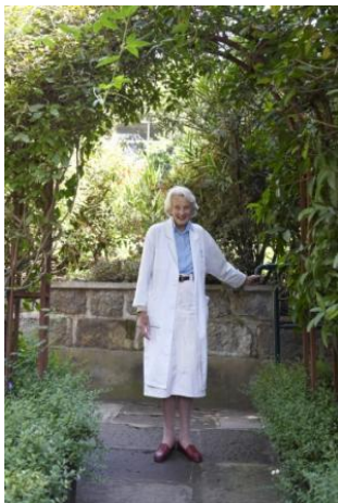
Dr. Catherine Hamlin

Zunächst möchte ich Ihnen einen Eindruck von der Verwendung der gespendeten Mittel in Äthiopien geben. Als Fistula e.V. sind wir Teil eines internationalen Netzwerks, mit Partnern in Australien, Großbritannien, Japan, Neuseeland, den Niederlanden, Schweden, der Schweiz und den USA. Außerdem unterstützen zahlreiche andere Organisationen das Fistula Hospital und andere Projekte. Das Fistula Hospital in Äthiopien hat sich in den