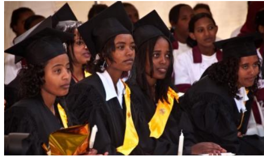
Die ersten Hamlin Hebammen