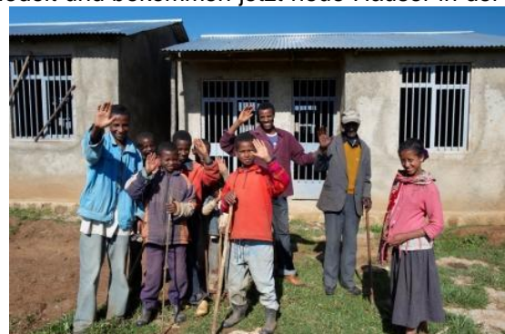
Die Siedler vor ihren neuen Häusern 1