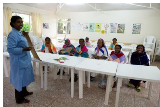
Eine Schulklasse im Fistula Hospital

Jede Woche sprechen wir auch über Mütter-gesundheit und Gesundheitsvorsorge. Unsere Krankenschwestern klären die Patientinnen über schädliche Gesundheitspraktiken auf, die vor allem in ländlichen Gegenden noch sehr verbreitet sind.